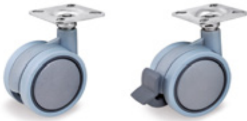
Ruedas de poliamida 6 gris