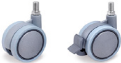
Ruedas de poliamida 6 gris