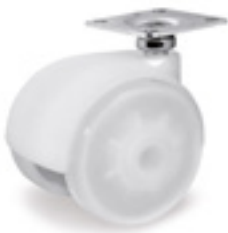
Ruedas de polipropileno transparente