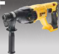
MARTILLO SIN ESCOBILLAS CPROF398