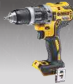
TALADRO PERCUTOR CPROF538