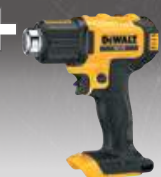
PISTOLA DE AIRE CALIENTE CPROF597