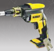
ATORNILLADOR PANEL YESO CPROF296