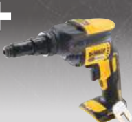
ATORNILLADOR ESTRUCTURA METÁLICA CPROF399