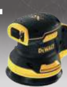
LIJADORA ROTORBITAL CPROF560