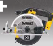
SIERRA CIRCULAR Ø165mm CPROF142