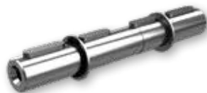
Eje lento doble